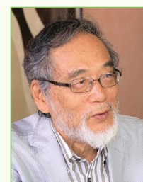
汐見稔幸先生 (東京大学名誉教授)